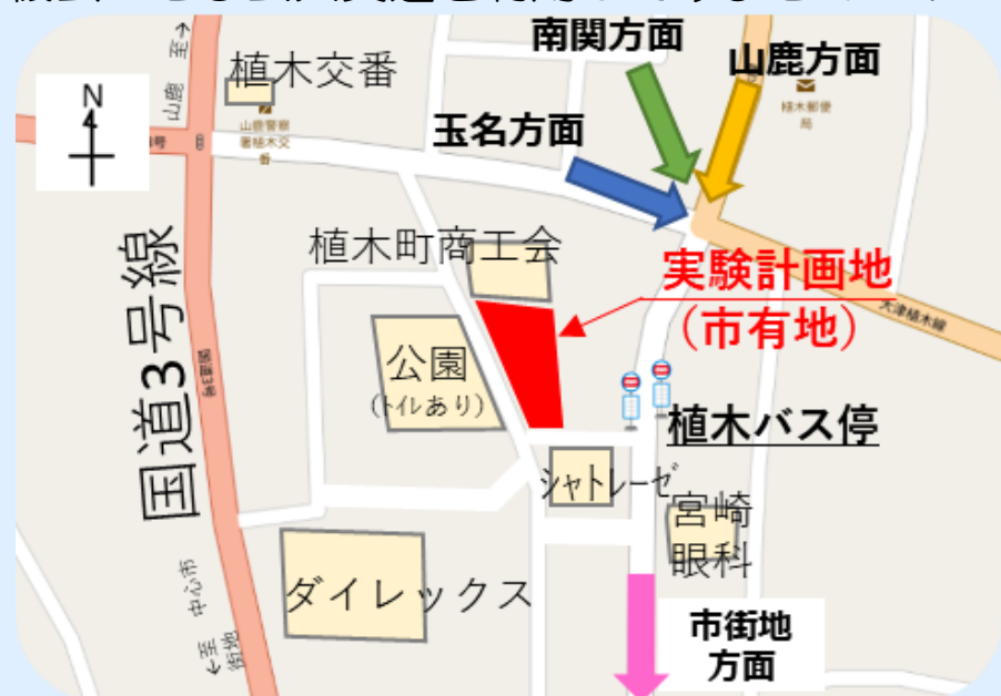
植木バス停周辺地図

パーク&ライド、サイクル&ライドには様々なメリットがございます！通勤や通学、お買い物など、この機会にぜひ公共交通を利用してみませんか？